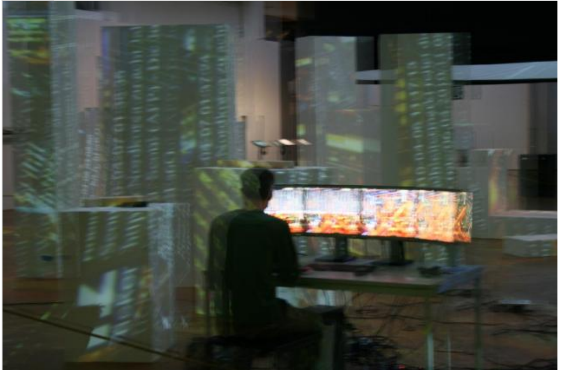
Marc Lee, 10.000 moving cities - same but different, 2010, Ausstellungsansicht, Foto: Katrin Heitlinger