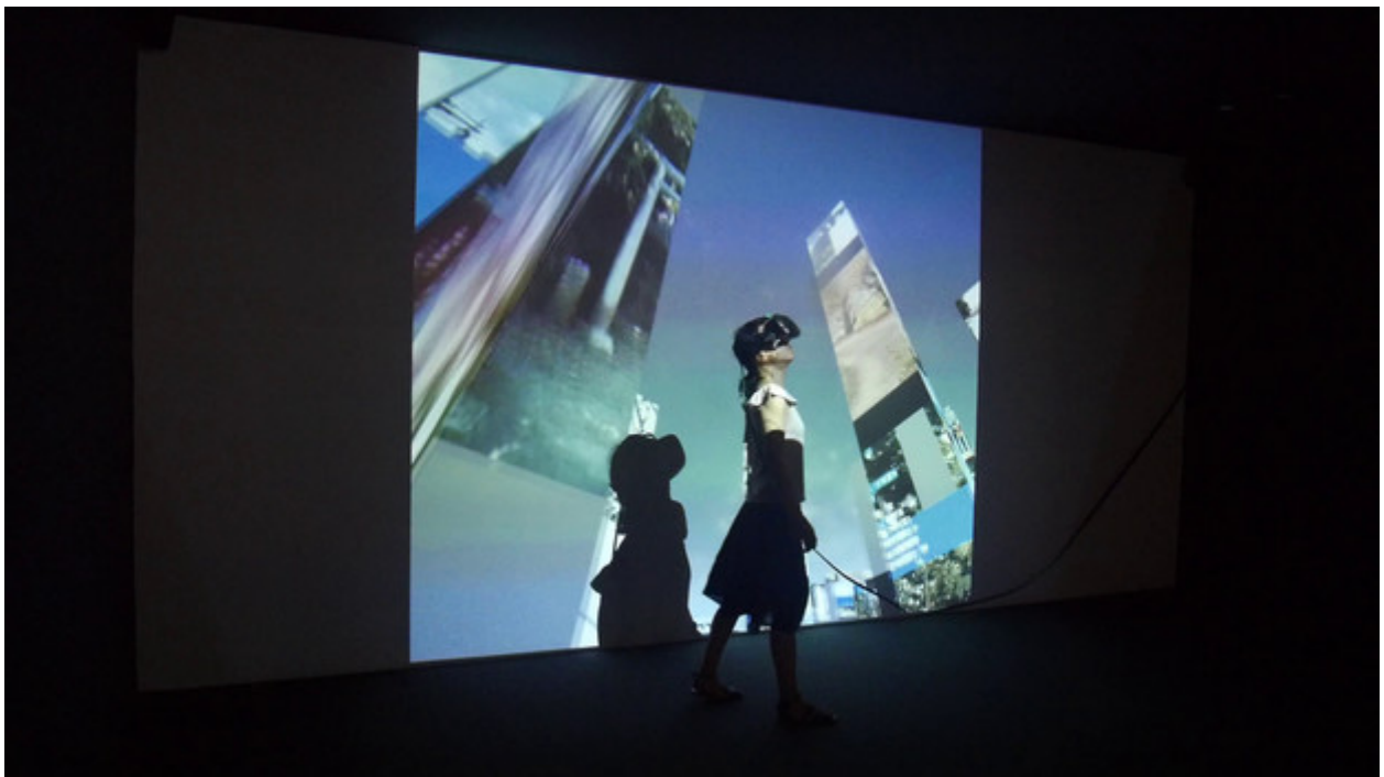
Auch Marc Lees Arbeit «10.000 moving cities - same but different» spielt mit der Idee der virtuellen Reise. MARC LEE, 10.000 MOVING CITIES - SAME BUT DIFFERENT (VERSION 4), 2016

Auch Marc Lees Arbeit «10.000 moving cities – same but different» spielt mit der Idee der virtuellen Reise. Mittels Blick kann auf einer Landkarte ein Ziel ausgewählt werden. Anschliessend werden Fotos dieses Ortes auf Wolkenkratzer projiziert, in denen man sich bewegen kann. Ich wählte übrigens Bern und spazierte entlang nächtlicher Lauben durch eine Mischung aus Gotham City und Bundesstadt. Ganz schön skurril.